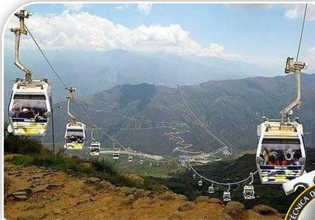
Parque Nacional del Chicamocha