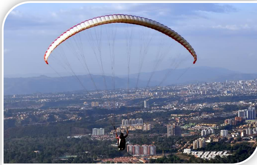
Voladero de las Aguilas